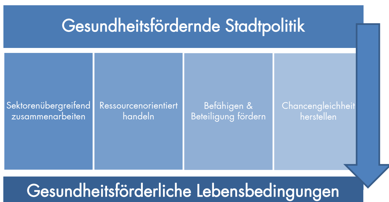
Abbildung 2: Prinzipien der Stadt Graz (eigene Darstellung)

Die Grazer Stadtpolitik lässt sich von folgenden Prinzipien leiten, die miteinander vernetzt sind und sich wechselseitig beeinflussen. Die daraus abgeleiteten Leitsätze greifen diese Prinzipien auf und benennen wichtige Inhalte, Werte und Grundgedanken im Sinne einer nachhaltigen gesundheitsfördernden Politikgestaltung. Da sich die einzelnen Leitsätze auf die Prinzipien beziehen, werden Themenfelder im Gesundheitsleitbild der Stadt Graz mehrfach genannt und nehmen auch in den einzelnen Leitsätzen aufeinander Bezug. Dadurch soll zum Ausdruck gebracht werden, dass eine gesundheitsfördernde Stadtpolitik von mehreren Faktoren abhängt, die sich wiederum beeinflussen.